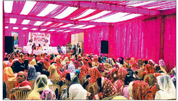
नारनौल। हिंदू सम्मेलन में मौजूद आमजन।

नगर की भगत सिंह बस्ती स्थित श्री कडियावाला हनुमान मंदिर में मंगलवार को भव्य एवं प्रेरणादायक हिंदू सम्मेलन का आयोजन किया गया। सम्मेलन से पूर्व क्षेत्र में दो भव्य ध्वज यात्राएं निकाली गईं, जिनमें आसपास के क्षेत्रों से बड़ी संख्या में श्रद्धालुओं व कार्यकर्ताओं ने उत्साहपूर्वक सहभागिता की। पहली ध्वज यात्रा ग्राम ढाणी कोजिंदा से निकाली गई, जिसमें 400 से अधिक महिलाओं ने पारंपरिक वेशभूषा में हाथों में भगवा ध्वज लेकर अनुशासित एवं भक्तिमय वातावरण में सहभागिता की। दूसरी ध्वज यात्रा बहरोड़ रोड स्थित अंडरपास के निकट क्षेत्र से प्रारंभ हुई, जिसमें 400 से अधिक पुरुषों एवं महिलाओं ने भाग लिया। दोनों यात्राएं नगर के विभिन्न मार्गों से होती हुई श्री