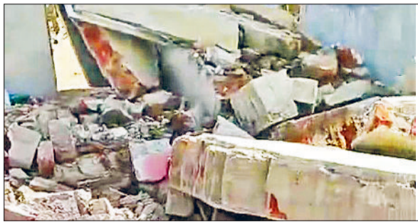
नारनौल। रघुनाथपुरा गांव में प्रशासन की ओर से हटाया गया अतिक्रमण व प्रशासन की ओर से नोटिस के बाद भी नहीं हटाया गया अतिक्रमण।

रघुनाथपुरा गांव में मंगलवार को प्रशासन की ओर से अतिक्रमण हटाने की कार्रवाई की गई, लेकिन कार्रवाई के बाद गांव में विवाद की स्थिति बन गई। ग्रामीणों का आरोप है कि कुछ लोगों के कब्जे हटाए गए, जबकि अन्य को छोड़ दिया गया, जिससे लोगों में रोष है। जानकारी के अनुसार