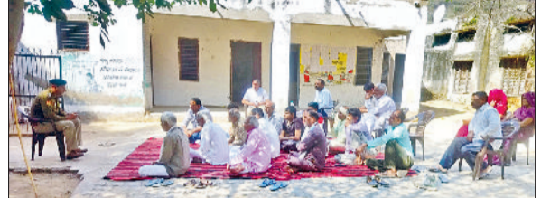
महेंद्रगढ़। सोहला में नशा मुक्ति अभियान चलाती पुलिस।